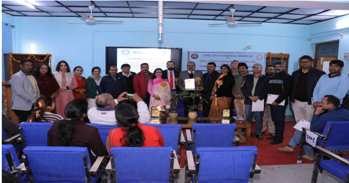
Presented Mementos to the Principal by Staff members