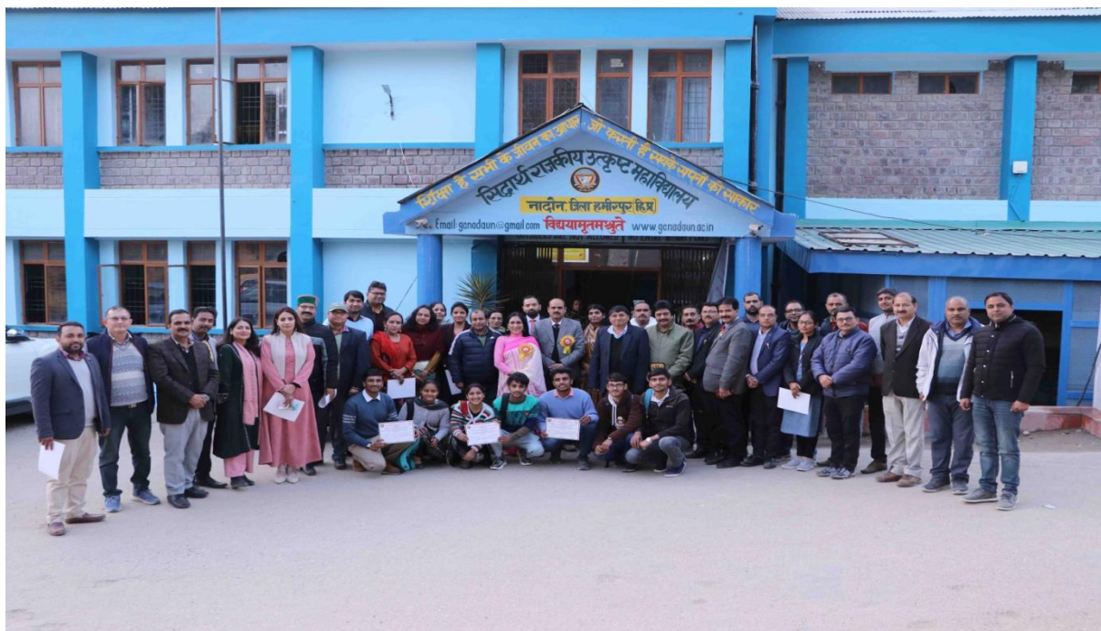
Group Photograph during the Seminar